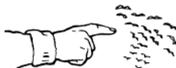
What are those birds?