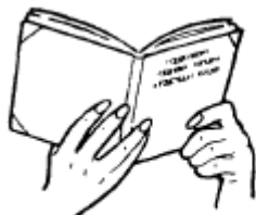
This book is really good.