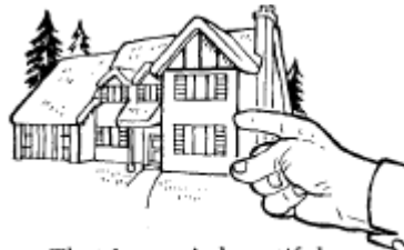
That house is beautiful.