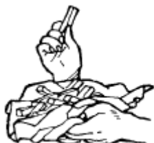
These chips are cold.